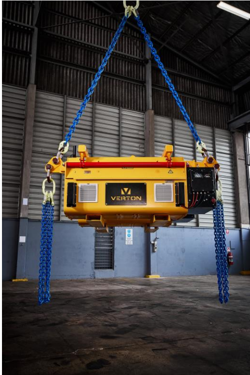
Abb1: Vertron Everest SpinPod 7.5