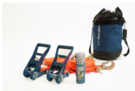
Zurrgurten-Set AK50, 8m im SpanSet Beutel